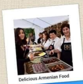
Delicious Armenian Food