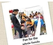
Fun for the whole family

Holy Resurrection Armenian Apostolic Church