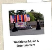
Traditional Music & Entertainment